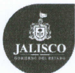
Ofelia Patricia Lomelí Plascencia

Teléfono: (33) 3030-4350, lada sin costo 01800 087-4350